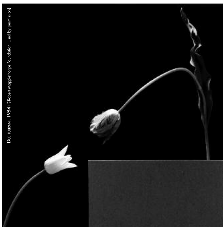
DUE TULIPANI, 1984