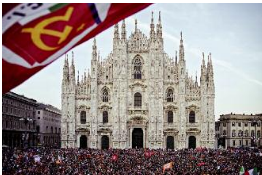
NAOKI TOMASINI, Piazza Duomo, saluto al neo eletto sindaco di Milano