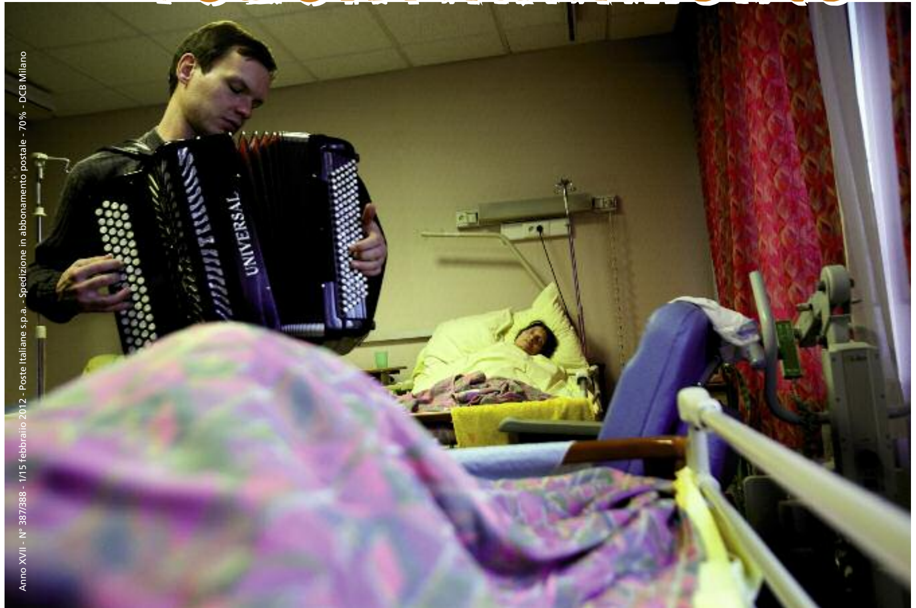
Anno XVII - N° 387/388 - 1/15 febbraio 2012 - Poste Italiane s.p.a. - Spedizione in abbonamento postale - 70% - DCB Milano