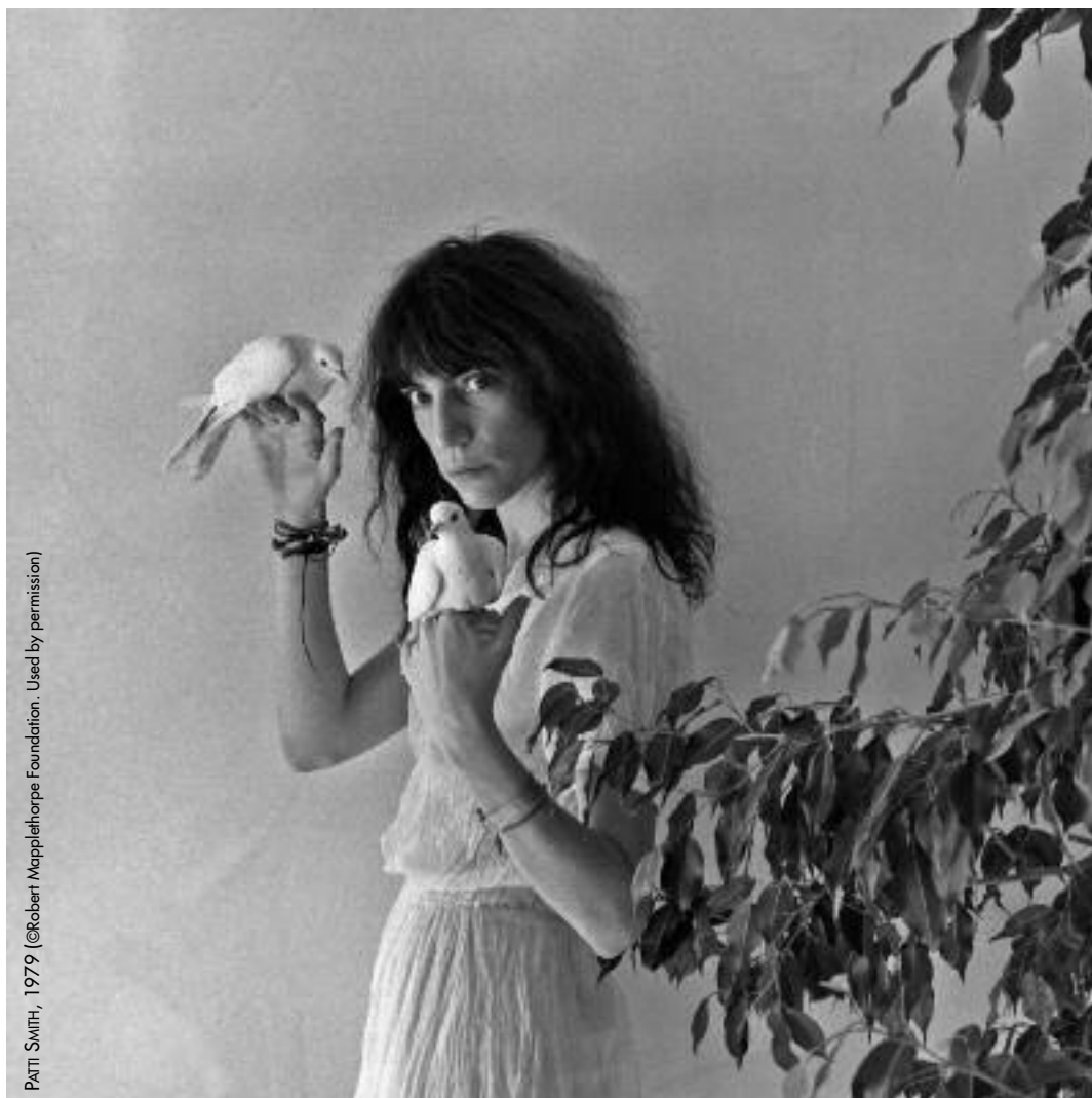
PATTI SMITH, 1979