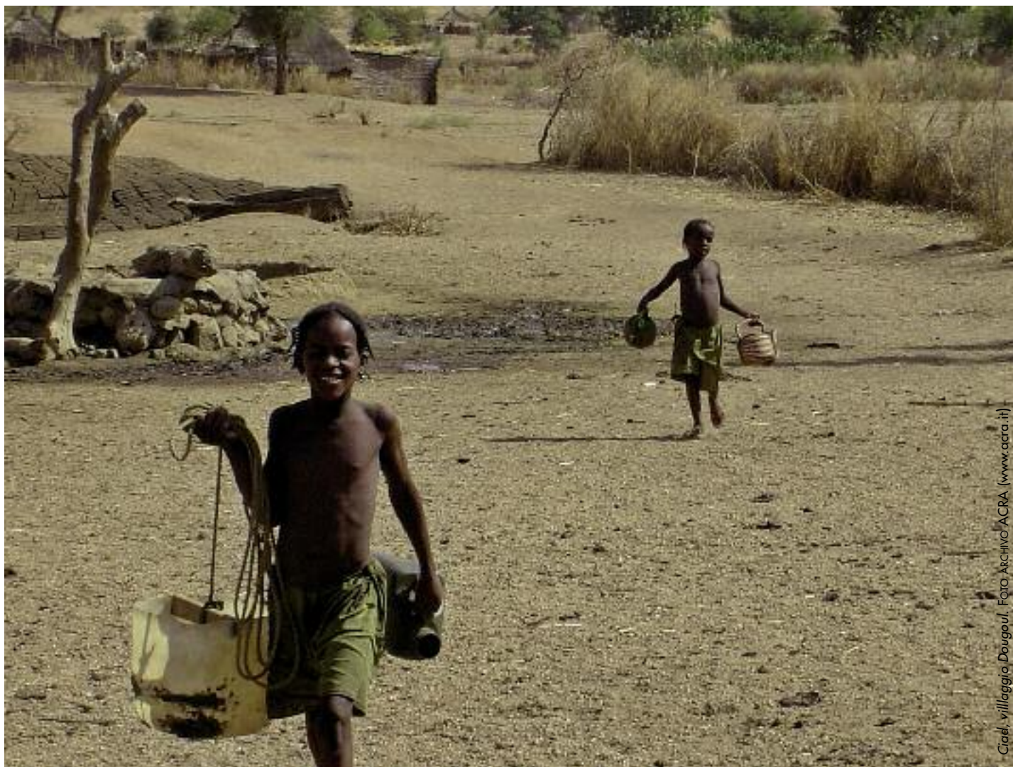
Cah, villaggio Dougoul, Foto Archivio ACRA (www.acra.it)

Questi diritti rappresentano il cammino della civilizzazione umana e non si possono cancellare o ridurre ad ogni cambio dello spread o a gradimento del mercato e delle agenzie di rating .