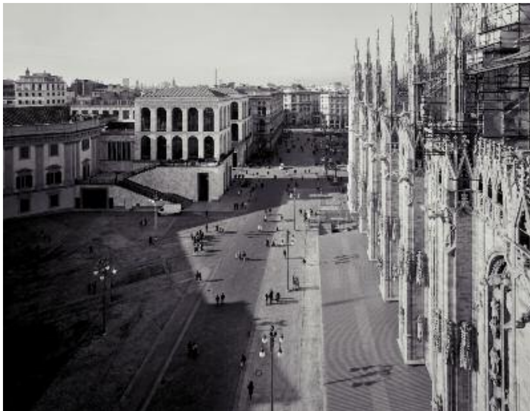
GABRIELE BASILICO, dal tetto del Duomo, 2011

T orna alla Galleria Bel Vedere l'appuntamento con Prima Visione, una mostra che è diventata un momento d'incontro grazie al quale la fotografia riflette sugli eventi e sui mutamenti che hanno coinvolto Milano. La città, rispetto allo scorso anno, è cambiata così come sono cambiate le persone che la governano. Al centro dell'obiettivo di quarantaquattro autori, affermati o giovanissimi, ritroviamo ancora i grandi cantieri che hanno mutato il suo profilo, ma anche periferie, architetture e strade di storica bellezza. Ritroviamo gli entusiasmi che hanno caratterizzato la campagna per l'elezione del sindaco ma anche momenti privati, sguardi intimi sulla realtà quotidiana. Colore e bianco e nero, immagini analogiche e digitali, tutti i linguaggi convivono e insieme sanciscono la vitalità della fotografia italiana, creando un mosaico che vuole raccontare quarantaquattro punti di vista sull'anno appena trascorso. A Milano.